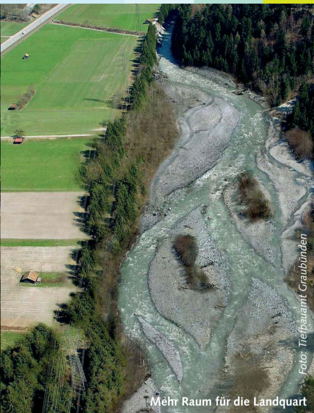
Mehr Raum für die Landquart