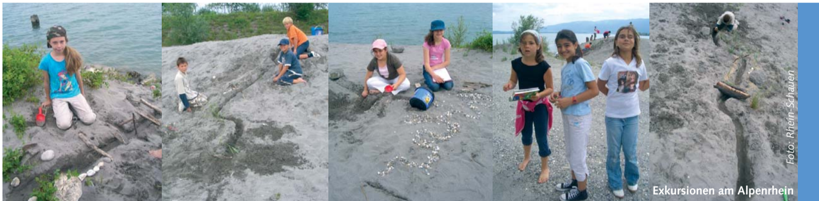
Exkursionen am Alpenrhein

mit den in Graubünden zuständigen Gemeinden gelöst. Es ist damit zu rechnen, dass ab 2008 schrittweise gewisse Projekte oder Teilprojekte des EKA noch genauer definiert werden können. Das Wichtigste ist dabei, den notwendigen Raum entlang der Ufer des Alpenrheins zu sichern.»